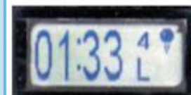
液晶モニターイメージ

5G5E (5群5層) の全ガラスレンズにより熱・紫外線による劣化なし！ ドライブレコーダーとして必須の適正画角 (左右約118°・上下約90°)