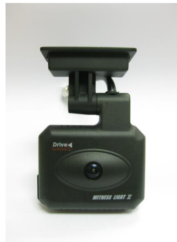
WITNESS Light II - G